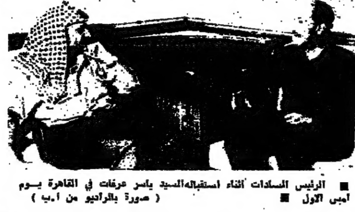
الرئيس السادات أثناء استقباله السيد ياسر عرفات في القاهرة يوم امس الاول